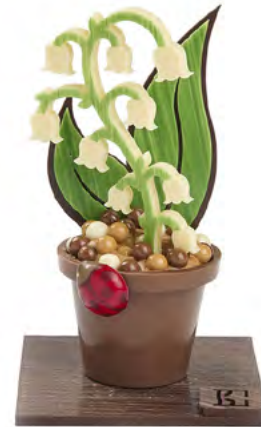
1er mai 2024