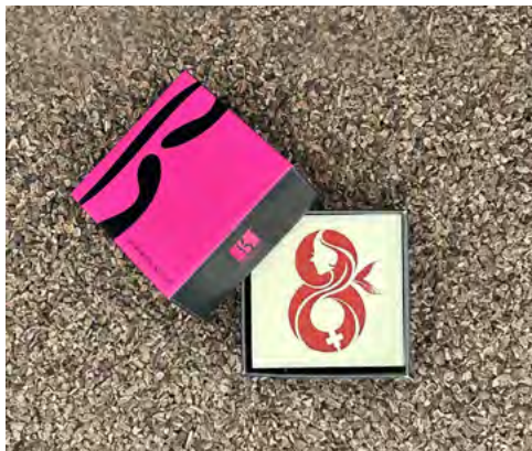
Journée de la femme 2024