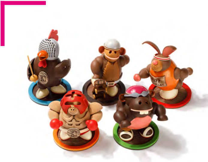
Collection Pâques 2024